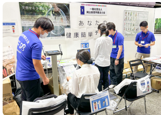
介護サービス博覧会 中四国 マッチングプラザ2025 岡山県理学療法士会展示ブース

是非、職場のスタッフの皆さまとお誘い合わせの上、ご来場ください。皆さまのご参加を心よりお待ちしております。