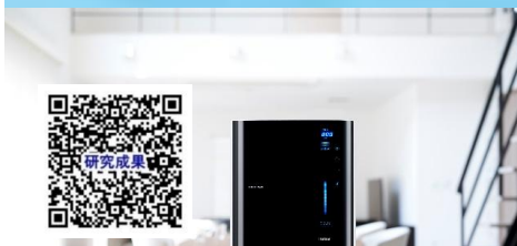
【エビデンスブック】 『電解水素水』の論文資料でご覧いただけます。